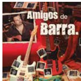
Amigos de Barra (2011)