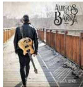
Barra Libre (2019)