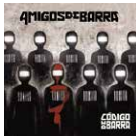
Código de Barra (2013)