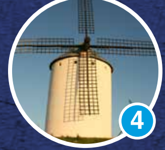
Molino Culebro Museo Sara Montiel