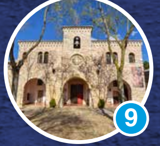
Santuario del Cristo de Villajos