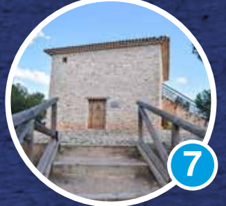
Pozo de Nieve