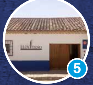
Museo Eloy Tenó Espacio de Artesanos