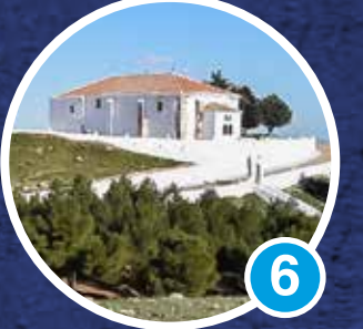
Santuario de la Virgen de Criptana