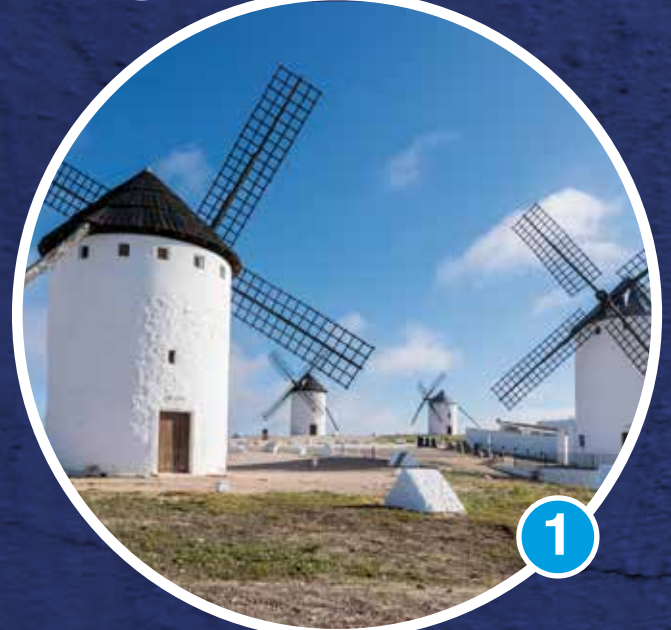
Molinos de Viento del siglo XVI