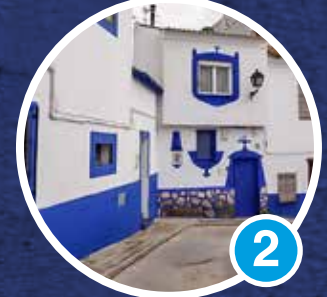
Barrio del Albaicín